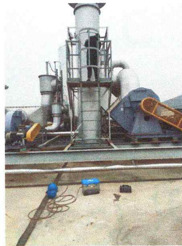
车间一排气筒出口 01#