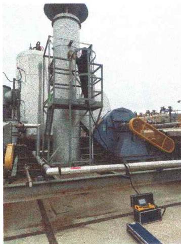
车间二排气筒出口 02#