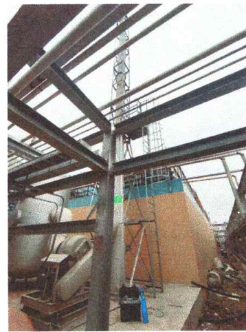
污水处理站排气筒出口 06#