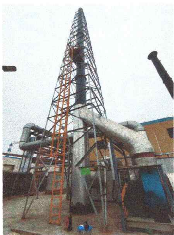
RTO 排气筒出口 05#