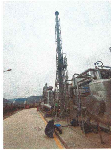
罐区一排气筒出口 04#